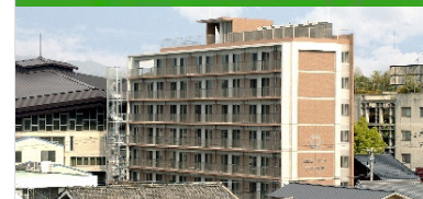
介護付有料老人ホーム メビウス大和郡山