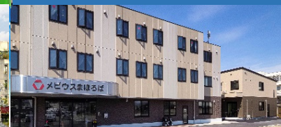
メビウスまほろば